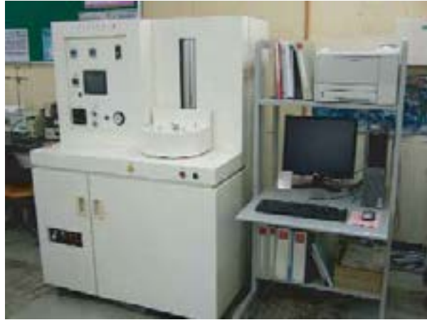
写真1 変態点測定装置 (アルバック理工(株) 機器名称:トランスマスターII)

呼ばれる試験機です。様々な変態を起こさせる為には鋼(試験片)を任意の時間、温度で加熱、冷却を精度良く実施しなければなりません。変態点の測定には作動トランスと呼ぶ微小変位が採取可能な装置を用いています。また試験片の加熱方法には本試験方法では現在2通りの方法があります。