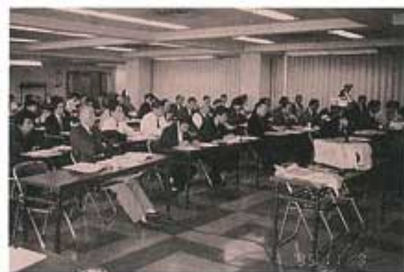
【写真3】ISO9000シリーズセミナー