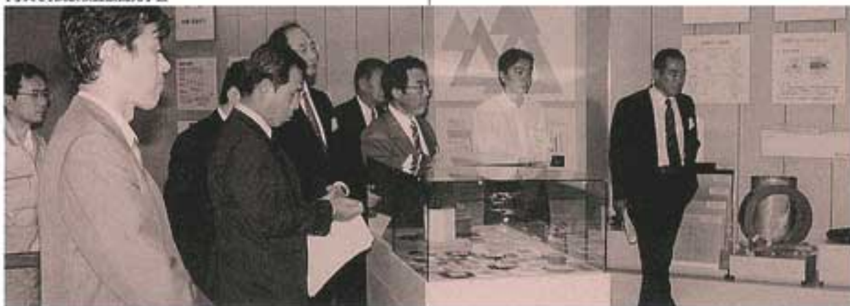
【写真2】試験検査設備見学会

また、昨年10月6日には、当社の本社講堂において初の大規模な技術セミナーを開催し、多数のご参加とご好評をいただきました【写真1】。盛沢山のプログラムのため質問時間が十分にとれず、ご迷惑をおかけしましたが、この試みについては今後も継続開催のご要望が強く、ご期待にそえるよう努力する所存です。