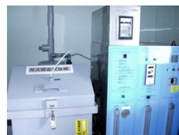
スガ試験機(株)製 ガス腐食試験機 GS-4型