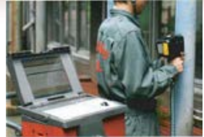
写真1 携帯型発光分光分析装置

分析-削りの繰り返しにより表面炭素濃度分布の把握が可能になり、浸炭深さ等を推定することができます。表面からの距離を把握するために、併せて超音波肉厚測定器で肉厚測定も繰り返し行います。この方法は、ほぼすべての鉄鋼材質の浸炭検査に対応可能です。