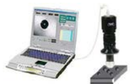
写真2 ブリネル圧痕読み取り装置構成例

このシステムはノートパソコン上で動作し軽量小型化されているので現場に持ち運びが出来る上、高精度の測定が可能となっています。また、現場での表面疵などの撮影にも活用出来ます。