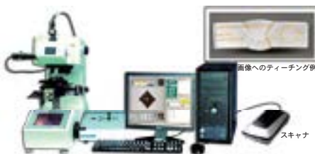
写真1 自動ビッカース硬さ試験システム ※本体は株式会社マツザワ製

正四角錐のダイヤモンド圧子を試料の表面に押し込み、試験力を圧痕表面積で割った値がビッカース硬さです。均質な材料に対して試験力の大小に関わらず一定の値が得られるので、微小部の硬さ評価に広く利用されています(写真1)。