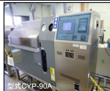
複合サイクル試験機外観

24hr/1サイクル 塩水噴霧 4hr 乾燥 5hr 湿潤 12hr 乾燥 2hr 外気導入 1hr