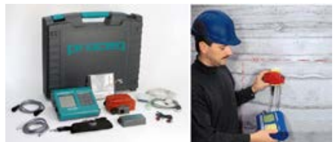
図2 電磁誘導装置(プロフォメータ 5)