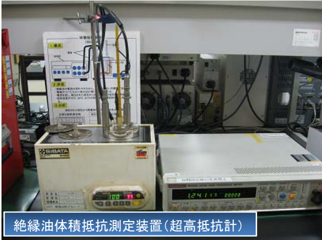
絶縁油体積抵抗測定装置 (超高抵抗計)

いずれも絶縁油の絶縁性を評価する指標ですが、相関性はあまりないといわれています。