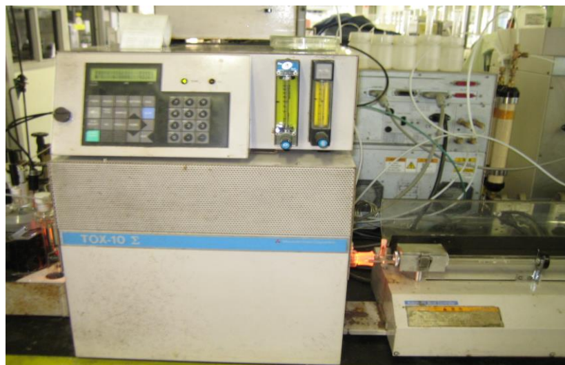
TOX-10 Σ (三菱化学株式会社製)