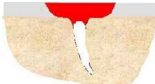
図2 浸透探傷試験の原理