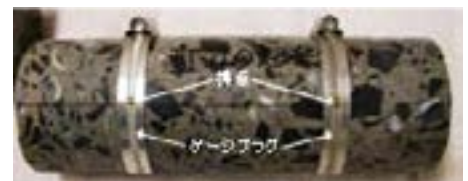
図2 ゲージプラグ取付けの実例(コンタクトゲージを用いる場合)