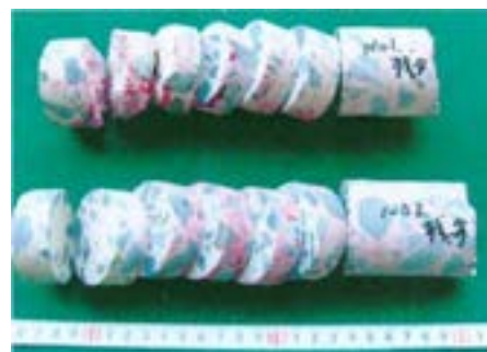
図1 コンクリートコアのスライス

塩化物量測定用の試料は、コアまたはドリル粉から採取します。コンクリート表面から深さ方向の塩化物量分布、特に鉄筋位置における塩化物量が重要となるため、ドリル粉を利用する場合は、表面からの深さを区切って採取します。コアを利用する場合は、図1のようにカッターを用いてスライスします。各サンプルを粗粉碎(ジョークラッシャー等)し、更に149 \mu m以下の粉末(振動ミル等)にしたものを分析用の試料として用います。