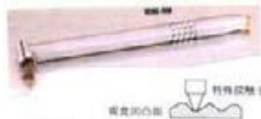
特殊探触子による 凹凸腐食部分の肉厚測定

肉厚測定には簡便なデジタル式超音波厚さ計が使用されていますが、腐食により表面に凹凸がある場合は測定値が安定しないので測定が困難になります。弊社では先端径の小さい特殊探触子とエコー波形が観測できるデジタル式超音波探傷器を用いて腐食部の残存肉厚を正確に測定します。