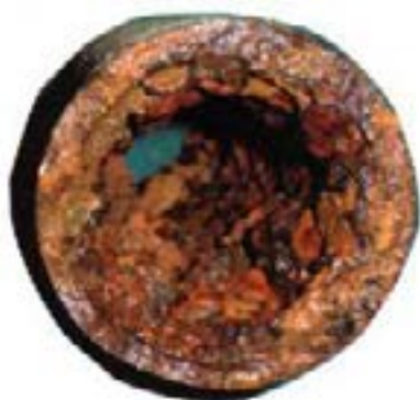
水道管の錆こぶ(スケール)付着状況