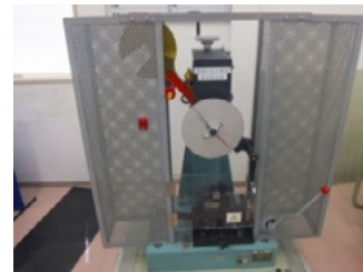
50Jシャルピー衝撃試験機の外観

試験機 : シャルピー振り子式衝撃試験機(米倉製作所製) 能力 : 50J 試験温度 : -196℃ ~ -140 ~ 200℃ * 低温域から高温域までの試験が可能です!