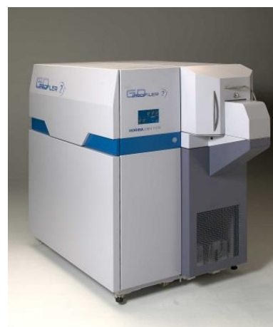
GD-Profiler 2 装置外観

H, Li, Be, B, C, N, O, Na, Mg, Al, Si, P, S, Cl, K, Ca, Ti, V, Cr, Mn, Fe, Co, Ni, Cu, Zn, Ga, Ge, As, Sr, Y, Zr, Nb, Mo, Ru, Rh, Pd, Ag, Cd, In, Sn, Ba, Hf, Ta, W, Ir, Pt, Au, Pb, Bi, La, Ce, Nd, Sm など