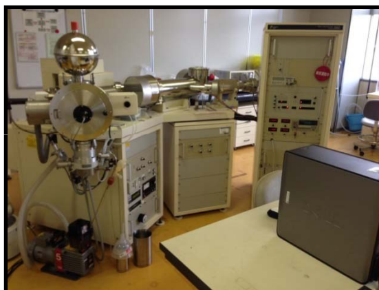
図1 装置外観(クリーンルーム内に設置)